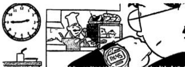
Figura 2. Relojes digital y analógico en los libros de texto (Ferrero, Gaztelu, Martín y Martínez, 2006, p. 61)

También hemos encontrado diferencias en el tipo de relojes que se trabajan en los libros de texto correspondientes a las diferentes etapas normativas objeto de análisis (ver Figura 2). En el libro de primer ciclo de la primera etapa (LEP) se recoge únicamente el reloj analógico. La diferencia principal entre el tratamiento del reloj entre la tercera etapa (LOGSE) y la cuarta (LOE), consiste en que la primera comienza con los relojes analógicos y después introduce el reloj digital, mientras que en la otra ley se introducen ambos tipos de relojes conjuntamente. En el libro de tercer ciclo LOGSE únicamente se recoge el reloj digital. Si prestamos atención a los descriptores considerados, el reloj se trabaja a través de todos ellos en las diferentes etapas en las que este instrumento está recogido en los libros de la LOGSE y la LOE.