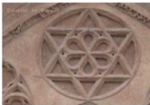
Catedral de Burgos

José María Sorando.matematicasentumundo.es