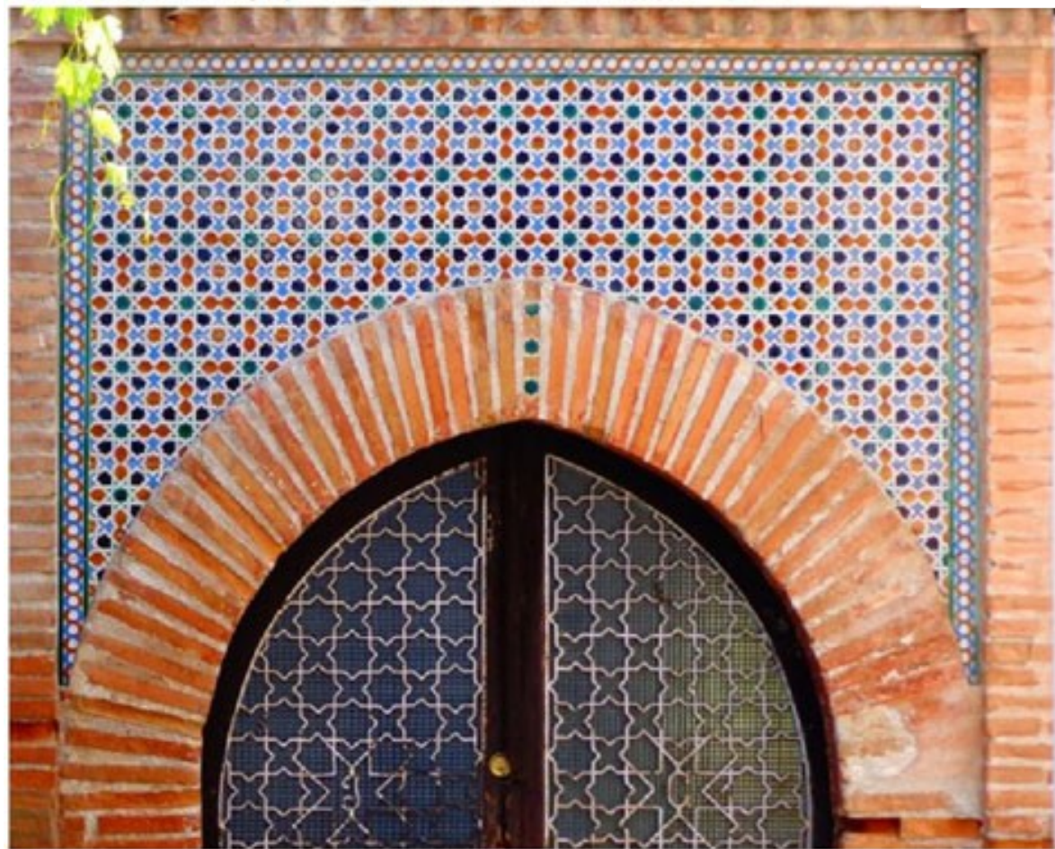
Puerta de las tres estrellas El Abaicín, Granada