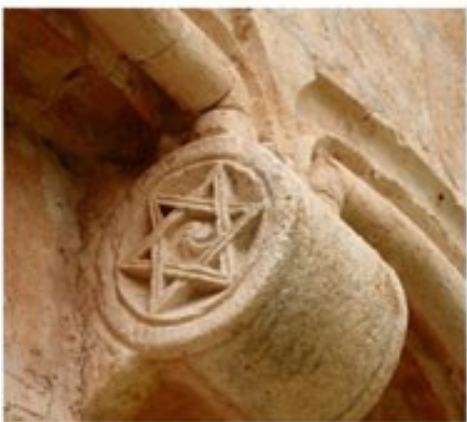
iglesia de Santa Coloma.