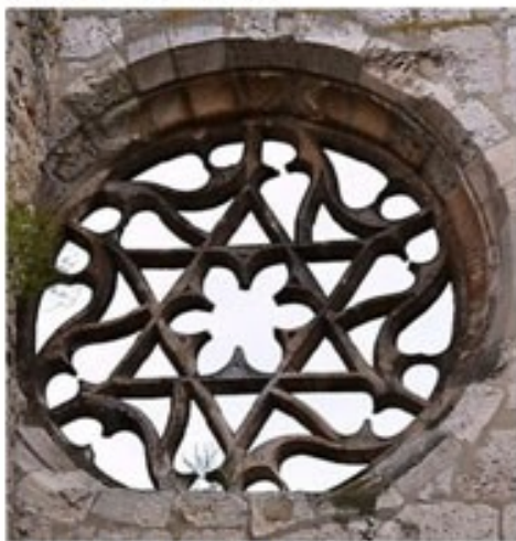
Iglesia de San Francisco.