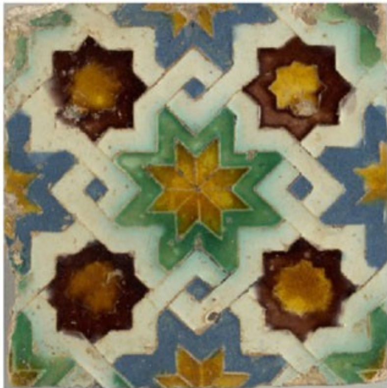
Azulejo de loza esmaltada, del siglo XVI