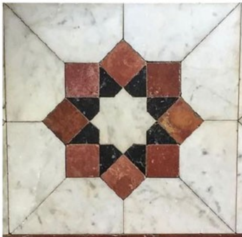
Azulejo islámico en marmol