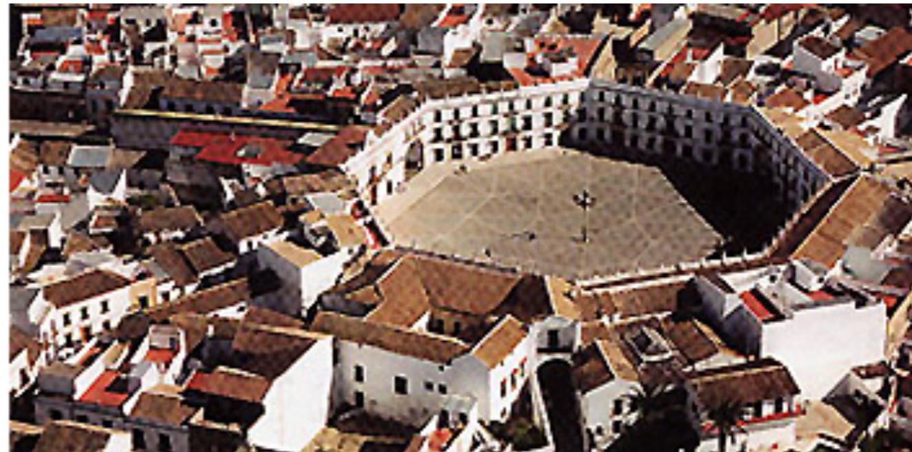
Plaza Ochavada de Aguilar de la Frontera