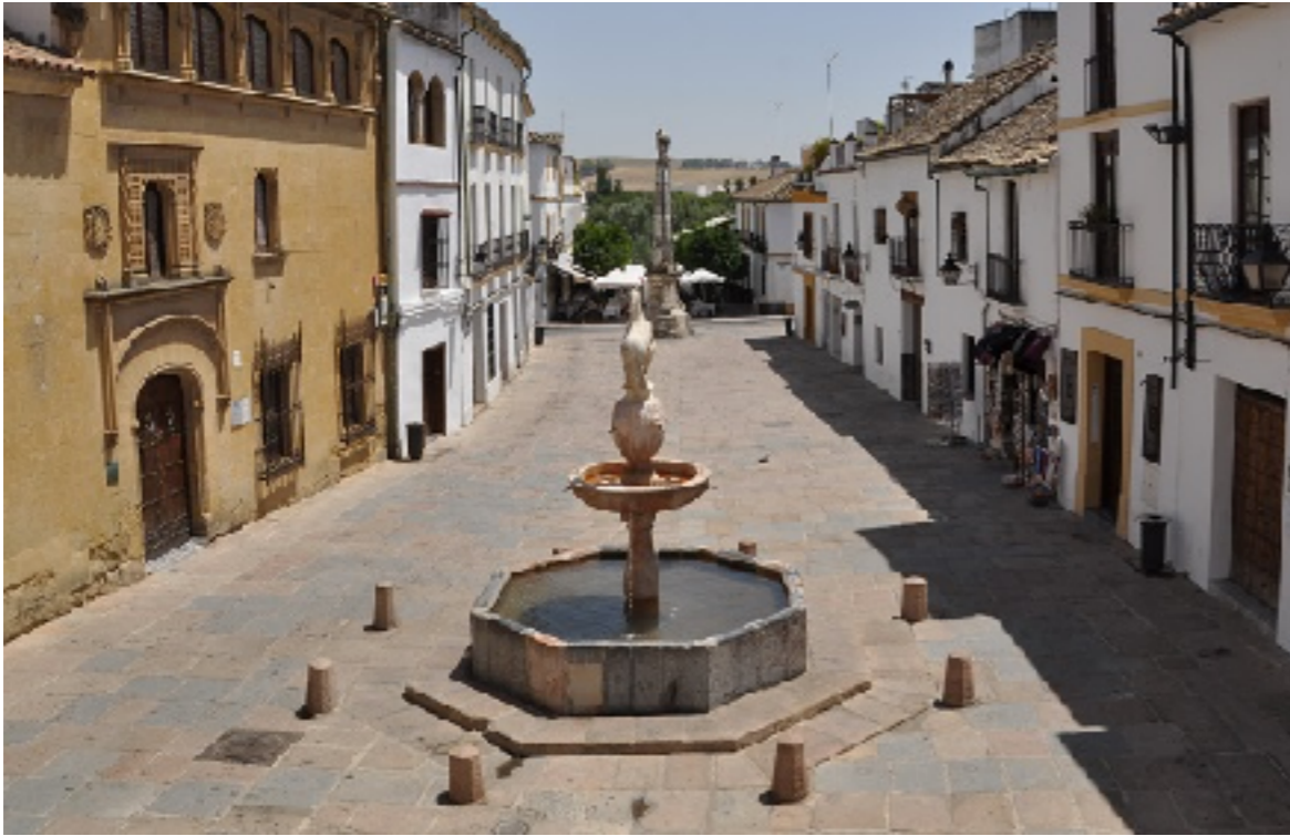
Plaza del Potro