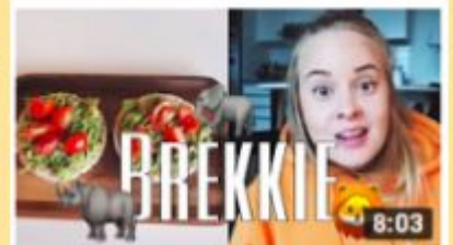
LÄHDEN SAFARILLE AFRIKKAAN

b) Tubettaja Mmiiasin videolla Lähden safarille Afrikkaan on 99 000 katselukertaa, ja se on ollut YouTubessa 9 viikkoa. Kuinka monta katselukertaa video on keskimäärin saanut viikossa?