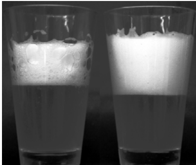
Abb. 5: Zerfall in zwei Gläsern: mit leicht fetten Fingern berührt (links) und im sauberen Glas (rechts)

Wie teile ich die Gruppe auf? Wer misst die Daten ab, wer notiert sie und wer stoppt die Zeit?